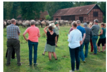
Bilder der Exkursion